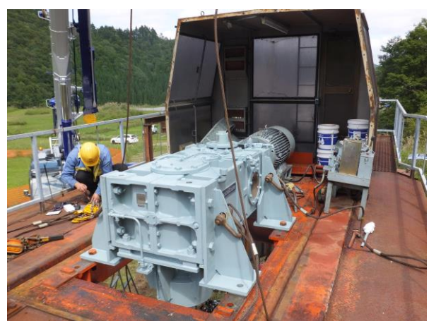
第3リフト 減速機オーバーホール