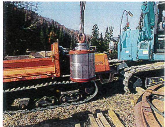
折り返し滑車軸ベアリング交換