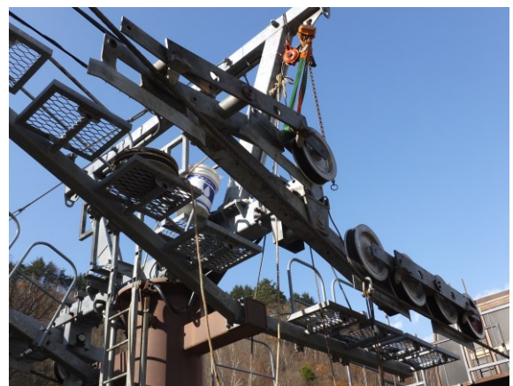
ピンブッシュ交換